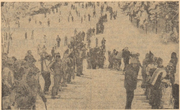
Întrecerile de schi pentru „Cupa U.A.S.C.R.”, din decembrie, de la Predeal, au confirmat tot mai largă adeziune a studenților bucureșteni pentru acest sport al sezonului alb