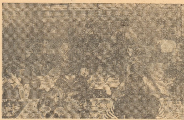
Foarte tinerii șahiști de la Calculatorul I.I.R.U.C. București au avut o comportare remarcabilă la concursul internațional de la Bydgoszcz — Polonia, unde au ocupat locul I.

Se muncește mult și cu eficiență (cum arată rezultatele la Calculatorul I.I.R.U.C. București pentru propășirea „sportului minții”, descoperirea unor noi talente — cifra totală a copiilor și juniorilor se apropie de 120 (după o prealabilă acțiune de selecție, anuală, care angajează cel puțin 1000 de elevi din toate secțiile Capitalei) și, implicit, pentru lansarea celor mai harnici pe orbita