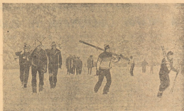
Ultimele ninsori căzute în Bucegi au revigorat activitatea la schi în toate stațiunile montane de pe Valea Prahovei. În imaginea surprinsă de fotoreporterul nostru Iorgu Bănică, la Predeal, iubitorii ai schiului — în aceste zile, tot mai mulți — urcînd pe pîrta de la Clăbucet...