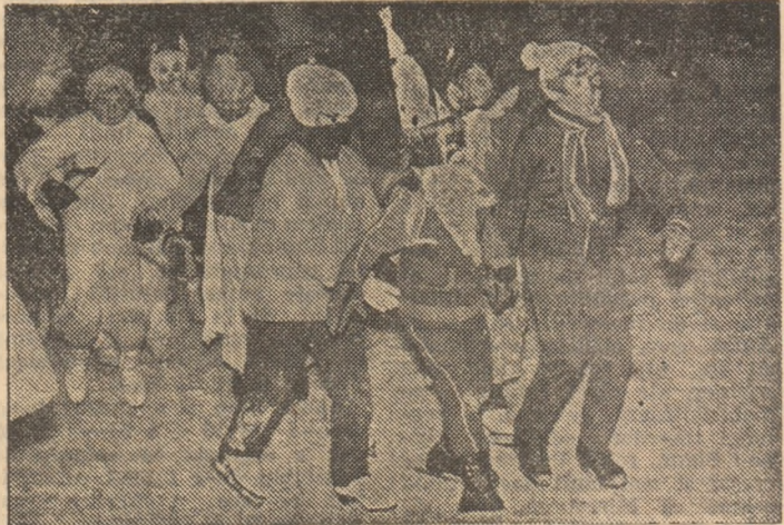
Cu măști sau fără măști, mai mult sau mai puțin siguri pe gheață, numeroșii îndrăgostiți de patinaj au trăit clipe de intensă bucurie în timpul „Carnavalului pe gheață” desfășurat la Gura Humorului...