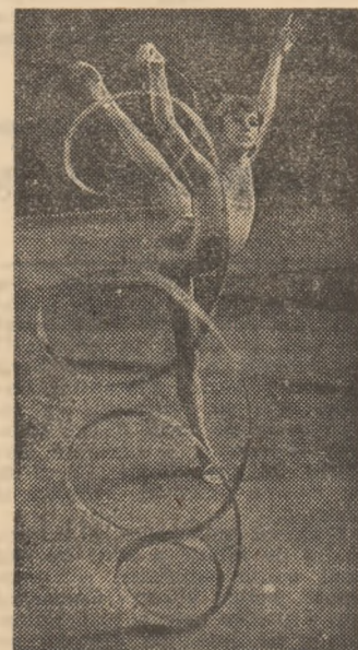
Grație, frumusețe, armonie... Florentina Butaru evoluînd în maniera ei caracteristică.