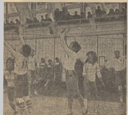
ra ediției în curs, Universitatea C.F.R. r întîlni din nou în turneul nr. 3, stuvictorie asupra bucureștenilor...

Se anunță interesant și turneul „plutonului doi” (valoric, apropiat de cel fruntas) în care formațiile de pe locurile sortite retrogradării vor face eforturi (și vor avea condiții, mai ales echipa organizatoare) să reducă distanța față de celelalte. Se va porni de la situația: Dacia Pitești 26 p, Chimia Rm. Vilcea 25 p, Calculatorul București 24 p, Penicilina Iași 22 p, Rapid București 19 p. Știința Bacău 19 p. Ca arbitri, vor oficia: M. Stamate, I. Armeanu, P. Pițurcă, C. Gogoșe, V. Ionescu, Cl. Murgulescu, Z. Moldoveanu, M. Constantinescu și M. Bojan. Programul începe azi (ca și în zilele următoare) la ora 13, în sala Rapid: Penicilina — Calculatorul, Rapid — Chimia și Știința — Dacia (A.B.).