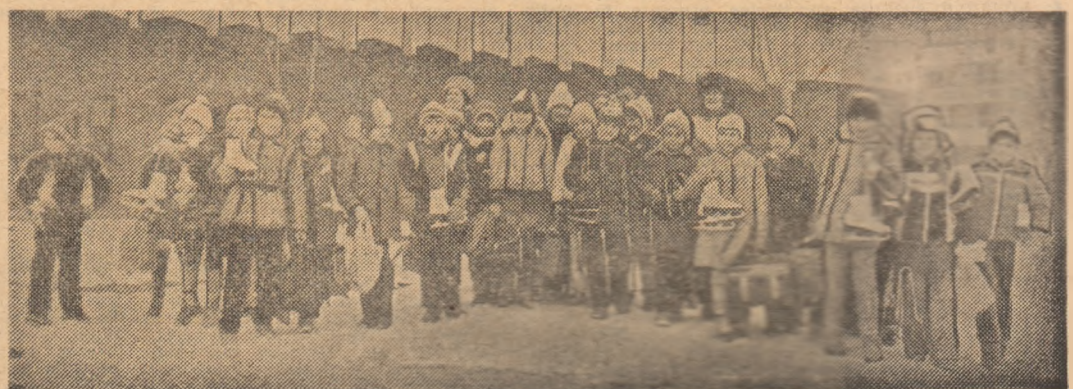
„Poză” de gheață”, cum le place localnicilor să numească patinoarul artificial, este zilnic deschis nu numai sportivilor de performanță, ci și amatorilor de patinaj. (Grup în pag. 2-3: „24 de ore la S.C. Miercurea Ciuc”).

Ca în fiecare an, Federația Română de Lupte organizează un turneu de selecție pentru completarea lotului național, întrecerile fiind dotate cu „Cupa 16 Februarie”. Competiția se va desfășura în sala Dinamo din Brașov, în zilele de 8 și 9 februarie. Primii care se vor alina la startul „Cupei 16 Februarie” sînt sportivii de la stilul greco-romane. Conform prevederilor regulamentului sînt admiși în competiție numai sportivii între 17 și 22 de ani.