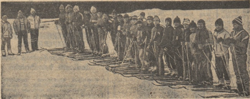
Lotul reprezentativ de lupte greco-romane primește indicații înaintea startului la antrenamentul de... schi fond