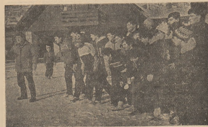
Lotul de judo ia startul spre... înălțimea munților.