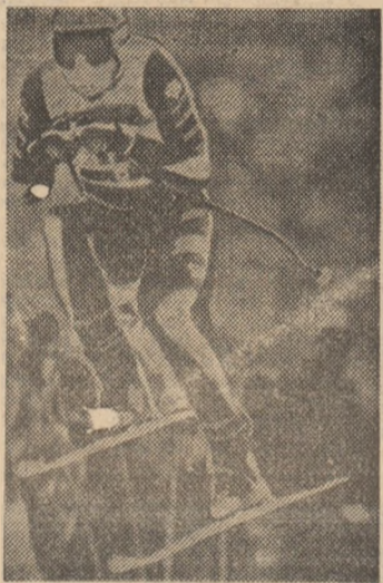
Schiorul elvețian Peter Müller a câștigat proba de coborîre de la Morzine.

● La Lake Placid (statul New York) a avut loc ultima etapă