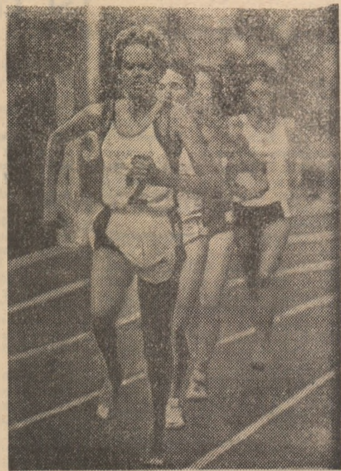
Aspect de la concursul de la Cosford. Zola Budd conduce grupul alergătoarelor de la 3 000 m.

● Alergătorul tanzanian Juma Ikangaa a fost câștigătorul concursului internațional de maraton de la Tokio. La capătul celor 42,195 km el a fost înregistrat cu timpul excelent de 2:08:28. Pe locurile următoare s-au clasat