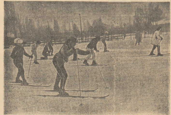
Schi fond pe stadionul Voința din Capitală (în imagine), pe alte baze sportive din cartiere