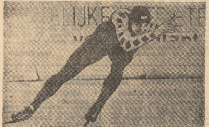
Noul campion al lumii la patinaj viteză este olandezul Hein Vergeer, pe care îl vedeți în timpul concursului de la Inzell.

INZELL. Pe pista acestei stațiuni vest-germane s-au desfășurat Campionatele mondiale de patinaj viteză. Titlul a re-