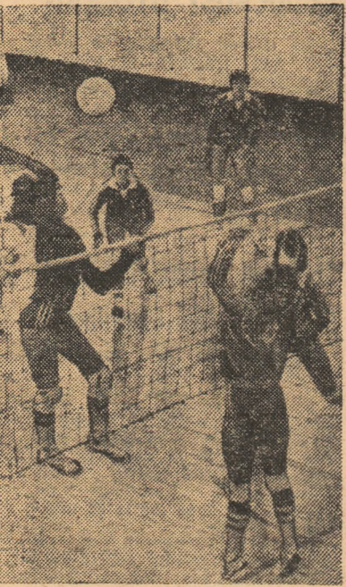
...stele (în stînga imaginii, cu ex-cra- Chitic în atac), speră să reducă față de lideră, în „fief”-ul acesteia...

bertatea Sibiu — Farul Con- stanța, Flacăra roșie București — C.S.U. Galați (sala M.I.U., ora 15), în grupa I valorică; Chimia Rm. Vilcea — Penicil- lina Iași, Dacia Pitești — Ra- pid București și Calculatorul București — Știința Bacău (sala Olimpia, ora 14), în grupa a II-a.