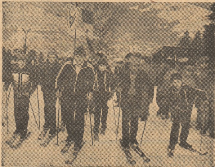
Aspect de la festivalul-concurs „Chemarea munților“. O parte dintre schiori urcă spre linia de start

sporturilor de iarnă, la care iau parte, o dată pe an, urmașii lui Horea și Iancu. La reușita acestui festival, desfășurat sub egida „Daciadei“, au