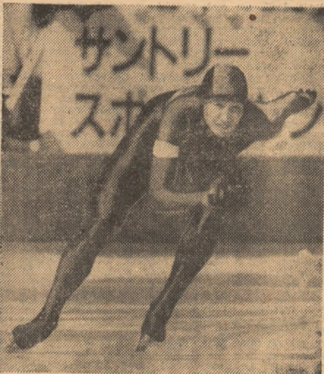
Una dintre cele mai valoroase sportive ale patinajului viteză mondial, Karin Kania-Enke (R.D. Germană), în timpul evoluției din cadrul recentelor Campionate mondiale de sprint de la Karuizawa (Japonia), pe care le-a dominat.

OSLO, 25 (Agerpres). — Proba de ștafetă 3x5 km din cadrul concursului internațional feminin de biatlon de la Holmenkollen (Norvegia) a fost câștigată de echipa Norvegiei, cu timpul de 1h 00:19. Pe locul secund s-a situat formația Finlandei — 1h 01:01.