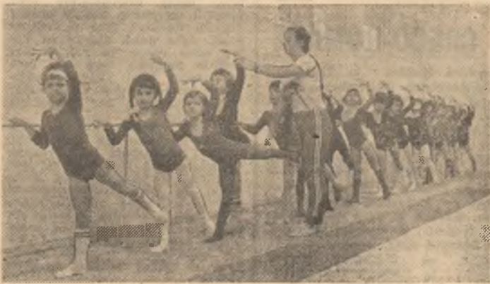
Primii pași în instruirea sportivă a micuțelor gimnaste

A surprins desigur că, în ultimii ani, gimnastica de la Centrul Onești s-a „văzut” mai discret în aria competițională de vîrf a gimnasticii noastre feminine, acest centru puternic și de tradiție părînd adesea resemnat în fața asaltului tot mai viguros al altor secții de gimnastică din țară. Plecarea la Deva, în anul 1978, a două dintre sportivele sale de vîrf, Ecaterina Szabo și Lavinia Agache, a descumpănit, parcă, activitatea acestei mari unități de performanță și poate că aceasta și explică, într-o măsură, rezultatele mai modeste obținute în perioada ce a urmat. Anii au trecut însă, în centrul de la Onești au