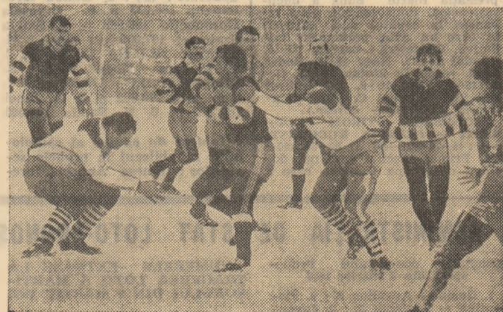
Atac dinamovist în meciul cu Rapid, în condițiile unui teren greu, acoperit cu zăpadă...

Seria I LOCOMOTIVA PĂSCANI — STEAUA 6-15 (6-8). Oaspeții s-au desprins greu, abia după pauză. Realizatori: DAVID, MOT. GIUCĂL — cite un eseu