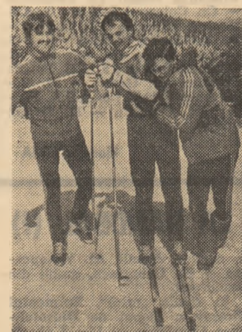
Componentii echipei sălăjene manifestîndu-și bucuria victoriei la sosirea ultimului schimb al stafetei...