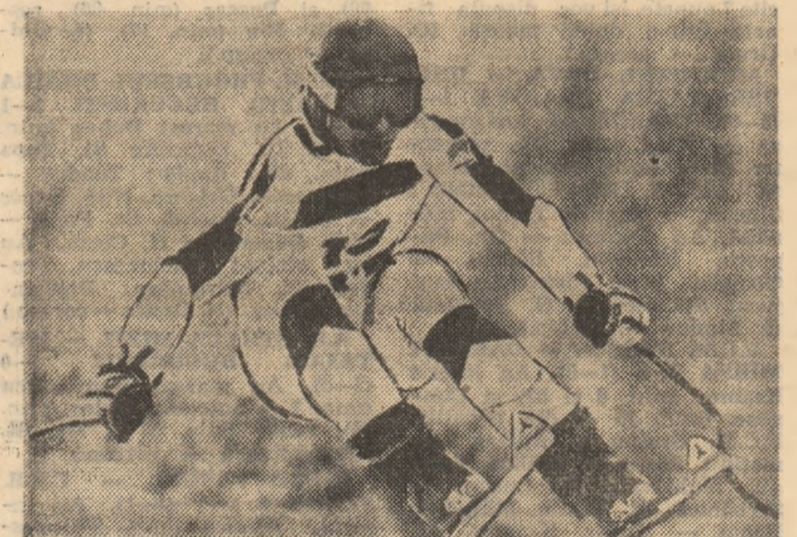
Marc Girardelli, principalul pretendent la „Cupa mondială” la schiul alpin

SÄLEN (SUECIA) . Peste 11.000 de concurenți au participat duminică la cea de a 62-a ediție a faimoasei competiții de schi-mare fond „Vasaloppet”. Pentru a doua oară consecutiv, victoria a revenit suedezului Bengt Hassis, cronometrat pe 85 km în 3:48:55 (el a întrecut cu peste 10 minute recordul competiției), 2. Anders Bleckvist (Suedia) 3:48:57, 3. Hans Persson (Suedia) 3:49:00. HEMSEDAL (NORVEGIA) . Concurs de slalom super-urias conținând pentru „Cupa mondială”. Pe primele locuri s-au clasat: 1. Pirmin Zurbriggen (Elveția) 1:37,44, 2. Markus Wasmeier (R.F.G.) 1:37,82, 3. Leonhard Stock (Austria) 1:38,78. În urma acestei curse, în clasamentul mondial al probei pe primul loc se află Wasmeier cu 65 p, urmat de