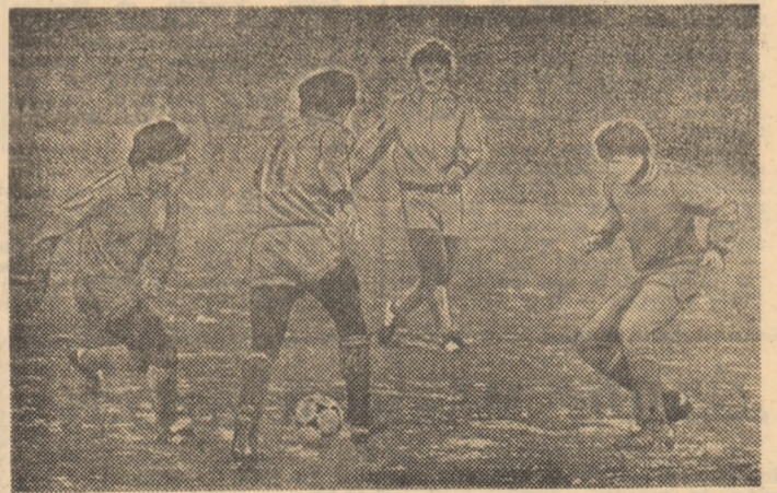
Aspect din timpul unuiu dintre antrenamentele efectuate de Steaua.

„Cărul „11” îi încredințăm misiunea de a realiza departajarea dorită?”, l-am întrebat