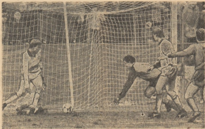
Unul din nenumăratele momente de panică la poarta lui Kuusysi Lahti...

Așa cum începuse Kuusysi Lahti prima manșă a disputei cu Steaua, din sferturile de finală ale Cupei Campionilor Europeni, era limpede pentru toți că formația finlandeză își limitează pretențiile la un joc strict defensiv, în dorința de a nu primi gol. Pentru atingerea obiectivului, oaspeții aveau un prețios aliat în starea terenului, greu, alunecos, așa cum de altfel se prezintă cimpurile de joc o bună parte de timp dintr-un an în „țara celor 1000 de lacuri”. De partea ccaaltă, în tabăra noastră, Steaua apare superioară la „capitolul tehnic” și, prin acțiuni desfășurate pe un front larg, încearcă și reușește să dezechilibreze o apărare supranumerică și foarte