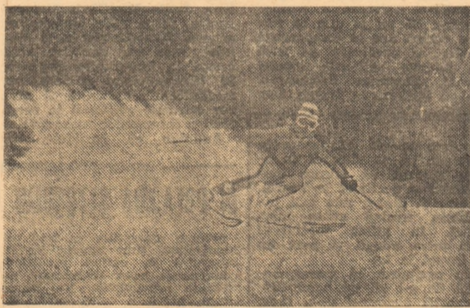
Splendoarea schiului, sport dinamic practicat în pitorescul mediu montan, este demonstrată de această ținută surprinsă, în „Zbor”, pe zăpadă de colaboratorul nostru din Bușteni, Victor Zbarcea.