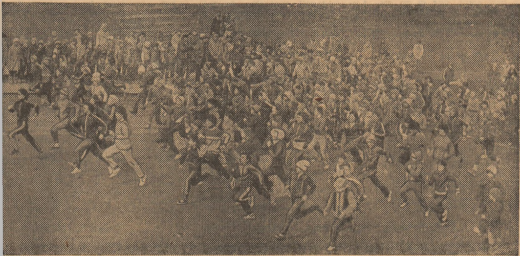
Imagine sugestivă din Concursul școlar de cros

„ALEARGĂ PENTRU SĂNĂTATEA TA!“ — UN ÎNDEMN RECEPȚIONAT DE SUTE DE COMPETITORI