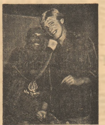
Doi mari vedete ale sportului se amuză, căci, dacă ar fi adevărat, desigur că Boris Becker ar fi fost ko. În urma loviturii la bărbie, executată de pugilistul Marvelus Marvin Hagler.

IUGOSLAVIA (et. 20). Steaua Roșie — Partizan 2-1, Titograd — Mostar 2-2, Dinamo Zagreb — Rijeka 0-0, Split — Pristina 2-2, O.F.K. — Novi Sad 2-1, Skopje — Osijek 1-0, Zelezni-