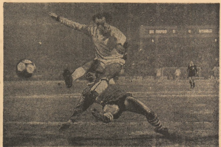
Așa a marcat sovieticul Belanov primul gol, la Viena (față din meciul tur dintre Rapid Viena — Dinamo Kiev 1-4).

Wilson 6-4, 6-3, Tim Mayotte — Scoti Davis 6-4, 6-3, Bud Schultz — Sammy Giammalva 6-4, 6-2, Eliot Teltcher — Lawson Duncan 7-6, 6-1, Todd Witsken — Paul McNamee 7-5, 3-6, 6-4. ● Concurs la Bruxelles confînd, de asemenea, pentru Marele Premiu: Emilio Sanchez — Ronald Agenor 6-4, 6-4, Marian Vajda — Vitas Gerulaitis 6-3, 6-1, Anders Jarryd — Brian Teacher 6-1, 6-2, Jeremy Bates — Sergio Casal 7-6, 6-2, Thomas Smid — Jan Gunnarsson 6-1, 7-6. ● Situația în fruntea clasamentului Circuitului feminin: 1. Martina Navratilova 3540 p, 2. Chris Evert — Lloyd 3400 p, 3. Claudia Kohde — Kilsch 2035 p, 4. Pam Shriver 1995 p, 5. Helena Sukova 1930 p, 6. Zina Garrison 1840 p, 7. Manuela Maleeva 1715 p, 8. Hana Mandlikova 1695 p. ● Clasamentul Marei Premii „Nabisco”: 1. Ivan Lendl 1250 p, 2. Joakim Nyström 798 p, 3. Yannick Noah 514 p, 4. Jimmy Connors 480 p, 5. Brad Gilbert 460 p, 6. Mats Wilander 423 p, 7. Ștefan Edberg 392 p, 8. Thierry Tulasne și Tim Mayotte 200 p, etc.