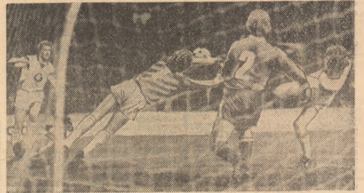
În turul precedent, Anderlecht (în tricouri albe) a eliminat pe Bayern München

● Meciuri restante în campionatul Angliei: Aston Villa — West Ham 2-1, Manchester Utd. — Luton 2-0, Oxford — Newcastle 1-2, West Bromwich —