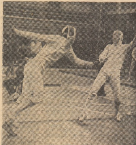
Un frumos asalt surprins în timpul pasionantelor întreceri ale „internaționalelor”

Turneul final consemnează pe locul 3 pe Filip Șabanski: 10-9 cu Piotr Sozanski (Polonia).