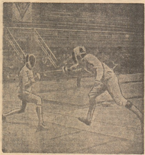
Un spectaculos asalt din grupă, în meciul România I - Legia Varșovia (9-3)