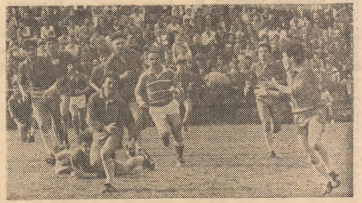
Una dintre numeroasele posibilități de atac ale echipei noastre...

viduale în locul pasel, greșindu-se transmisia sau recepția balonului. Iar cele patru lovituri de pedeapsă avute nu au însemnat puncte... Echipa noastră a dominat bune perioade, mai cu seamă în sfertul de oră inițial, dar de marcat au marcat adversarii, în min. 36 (eseu), când De Stefanil a găsit culoar liber (!) după o margine (în general plăcările au fost defectuoase, mai puțin cele ale curajoșilor aripi Rus). După pauză, Boldor a atacat impetuos fiind oprit în extremis (min. 44). Foca a încercat o intrare în forță, când avea coechipierii liberi în dreapta (min. 50), o altă acțiune românească s-a ratat la... ultima pasă (min. 53), pentru ca, în fine, Popișteanu să reușească un drop de efect în min. 54: 3-4. „Uvertura” noastră și-a repetat isprava peste 19 minute, printr-o execuție și mai spectaculoasă: 6-4! Replica italiană a fost imediată. Bonomi a încercat, la rîndul său, în două rînduri, dropul, Manteri a blocat un șut al lui