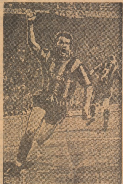
Tardelli deschide scorul în meciul Inter — Real Madrid, de miercuri, din Cupa U.E.F.A. și bucuria sa este fără margini...

● Se așteaptă un final fierbinte în campionatul italian din care au mai rămas patru etape. În fruntea clasamentului se află în continuare Juventus, care are 40 de puncte, urmată de Roma cu 37 p. Ce se va întâmpla în ultimele patru etape? Iată programul: la 6 aprilie: Fiorentina (locul 6) — Juventus și Roma — Sampdoria (locul 8); la 13 aprilie: Sampdoria — Juventus și Pisa (locul 13) — Roma; la 20 aprilie: Juventus — Milan (locul 6) și Roma — Lecce (locul 16); 27 aprilie: Lecce — Juven-