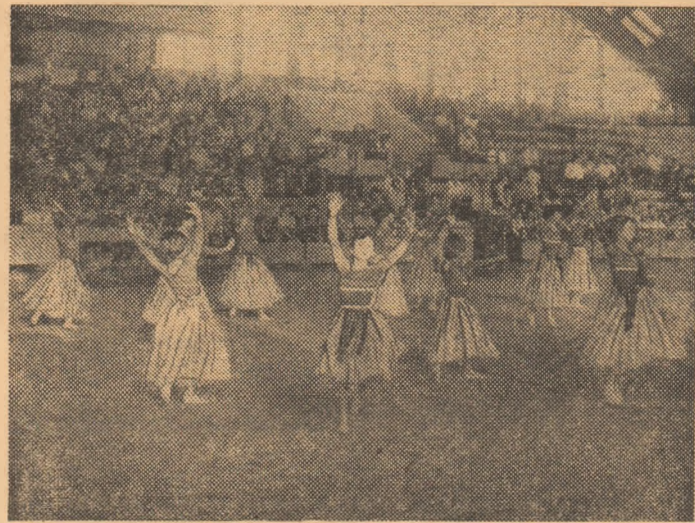
Secvență din spectacolul cultural-sportiv, organizat de Clubul Sportiv Școlar Triumf

De aproape trei decenii, Clubul Sportiv Școlar Triumf din București își reunește membrii și simpatizanții (mereu mulți și mai entuziaști) la frumoasele festivaluri cultural-sportive pe care le organizează. Cel care a avut loc recent a fost inițiat în întimpinarea