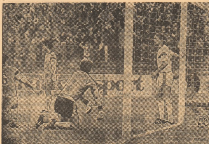
Consternare în tabăra belgiană. Anderlecht a fost eliminată!