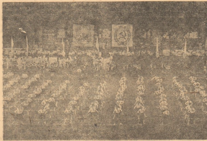
Gimnastica a ocupat primul loc la Festivalul de primăvară de pe Stadionul Tineretului. Iată o secvență convingătoare