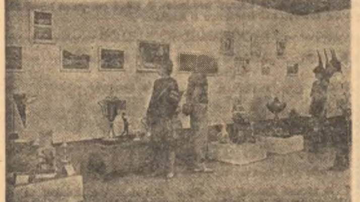
Aspect din Sala expoziției de fotografii și trofee „Sportivii români omagiază a 65-a aniversare a Partidului Comunist Român”.

O expoziție interesantă, reflectare a contribuției sportivilor noștri la creșterea prestigiului României socialiste... Modesto FERRARINI