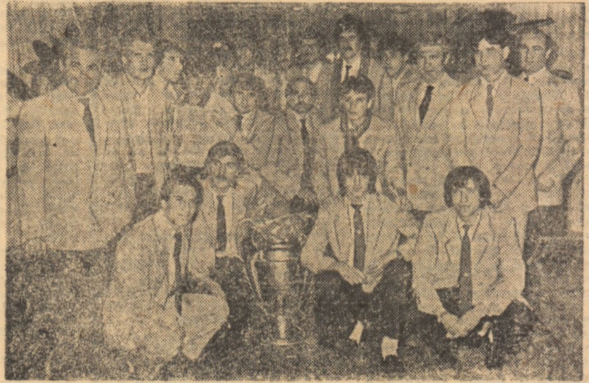
Inconjurînd cel mai prețios trofeu al competițiilor europene de club, cîștigătorii C.C.E. zîmbesc, fericiți, obiectivului fotografic la revenirea în Capitală.

„Sevilla, joi, la prinz. Orașul acesta care, cu o zi înainte, la aceeași oră, se îmbrăcase parcă în tricourile Barcelonei, se despărte cu respect de cîștigătoarea Cupei Campionilor Europeni, Steaua. Fotoreporterii roiesc în continuare în jurul „minunatei echipe române”. Jucătorii Stelei sînt foarte modesti. Semnează sute de autografe chiar dacă autocarul spre aeroport întirzie plecarea. La aeroport o altă invazie de fotoreporter. Toți vor să fotografieze Cupa Campionilor Europeni. Toți îl caută pe Ducadam. „Nu se poate așa ceva! Patru penalty-uri apărute într-un singur meci?!” sună leit-motivul ziaristilor spanioli. „Nu într-un meci, ci în cîteva minute!” îi corectează Marian Radu, Radu II, cum îi zicem noi. Pe aeroport, campioni europeni cumpără presa spaniolă. „Ce spun, frate, despre noi?!” îl aud pe Băr-