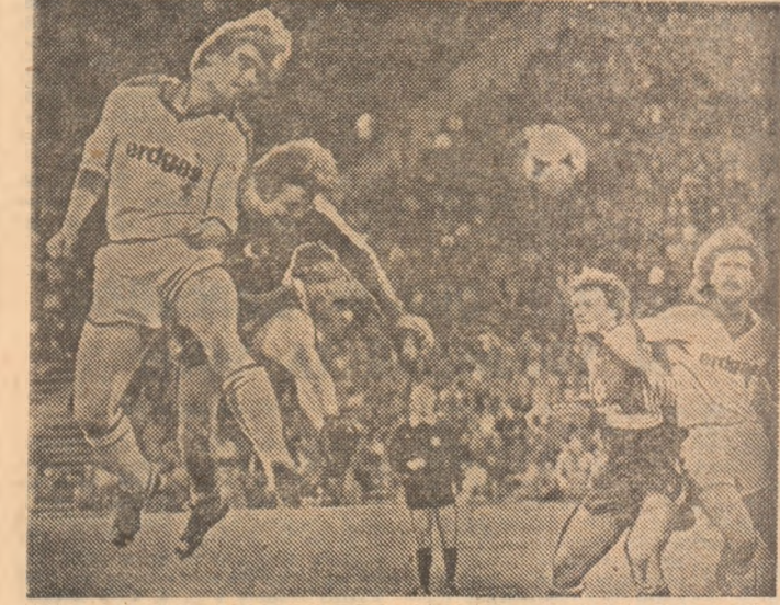
Internaționalul danez Lerby (al doilea din stînga, în tricou închis) trimite balonul cu capul spre poarta adversar, într-un meci cu Borussia Mönchengladbach.

52 p., 3. Feyenoord 43 p.; pe ultimele: 18. Maastricht 22 p., 17. Breda 21 p., 18. Heracles 12 p. R. D. GERMANIA (et. 25 — penultima). Magdeburg — F. C. Karl Marx-Stadt 1-0, Aue — Rostock 2-2, Union Berlin — Lokomotive Leipzig 1-1, Riesa — Dynamo Dresden 1-2, Jena — Dynamo Berlin 3-1, Frankfurt/O