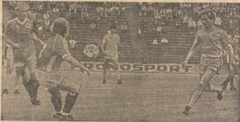
Boloni, la meciul nr. 90 în echipa națională, a jucat același rol important în dirijarea mecanismului „tricolorilor”

Ce ne-a arătat echipa noastră? Că valoarea rămâne va-