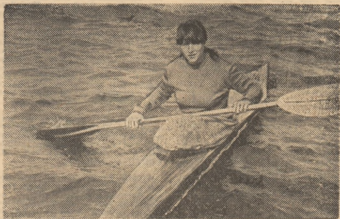
Campiona olimpică Tecla Borcânea — de trei ori victorioasă în recenta Regată Internațională Pitești

Baza nautică Bascov din Pitești — mereu mai frumoasă, mai bine dotată — a fost, simbatic și duminică, gazda unei atrăgătoare întreceri nautice: Regata Internațională Pitești la caiac-canoe. Competiția a reunit sportivi și sportive din șapte țări — Bulgaria R.P. Chineză, Cuba, Polonia Ungaria, U.R.S.S. și, bineînțeles, România — și a programat, în două disputate reuniuni, clasicele probe olimpice pe 500 și 1000 m. A fost o regată dominată de echipajele României, o întrecere bine organizată de federația de resort, cu sprijinul factorilor cu atribuții în sport din județul Argeș.