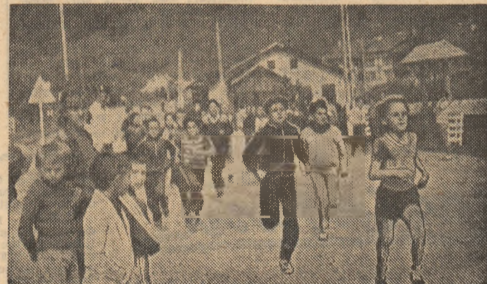
Aspect din desfășurarea unei probe de cros