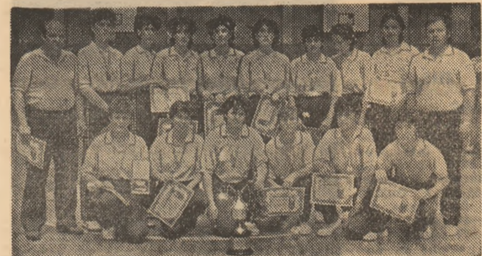
Echipa campioană (C.S.S. Galați), la câteva minute după festivitatea de premiere

Si dacă „provincia” și-a făcut datoria față de handbal, în schimb nici o formație din București (ca și în competiția masculină de altfel), nu s-a putut califica în turneul final. Este cu totul anormal și acest fapt va