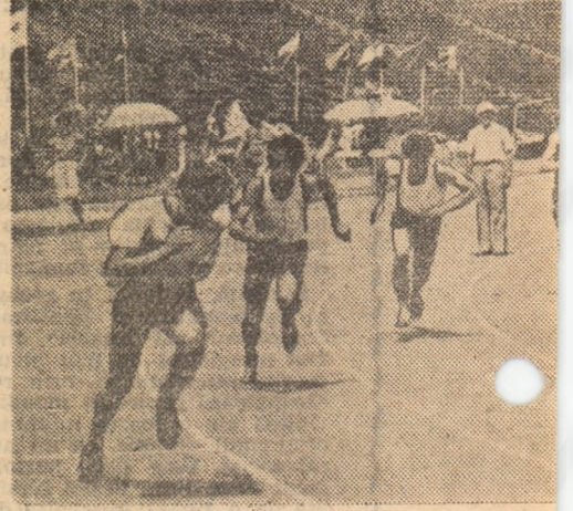
Unul din starturile Concursului de ștafete

În clasamentul I se află rești, urmat c și Timis. În final, încă se referă la m administrația S gust” din Car sprijine aceste titlurile (deoc aceleasi zile „Internaționale României.