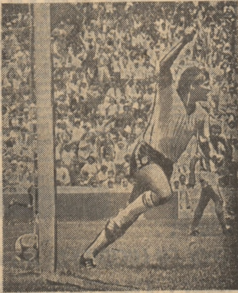
Garry Lineker își exprimă bucuria golului...

Dar scorurile sînt opera jucătorilor, a istețimii în ofensivă și eventualilor fisuri în sistemul defensiv advers, în general destul de bine pus la punct al unei formații sau al alteia. Curios, dar Danemarca, formație care realmente a strălucit în prima fază a „Mundialului“ a primit în „optimi“ cinci goluri, înscrind doar unul, în timp ce în cele trei partide anterioare golaverajul său fusese de 9-1! Principala artizană a victoriei echipei Spaniei, la Queretaro a fost înaintașul Butragueno, care a înscris, impresionant, 4 goluri! Este al optulea fotbalist din istorie care reușește să înscrie 4 goluri în numai 90 de minute ale unei partide din turneul final, după Leonidas - Brazilia și Willimowski - Polonia (în 1938, Brazilia - Polonia 6-5), Wetterström - Suedia (în 1936, Suedia - Cuba 8-0), Ademir - Brazilia (în 1930, Brazilia - Suedia 7-1), Korals - Ungaria (în 1954, Ungaria -