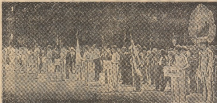
Pe platoul poligonului Tunari, participanții la întreceri în timpul festivității de deschidere de ieri.

● Numeroși campioni olimpici, mondiali și europeni pe standuri ● Primele probe încep la ora 9