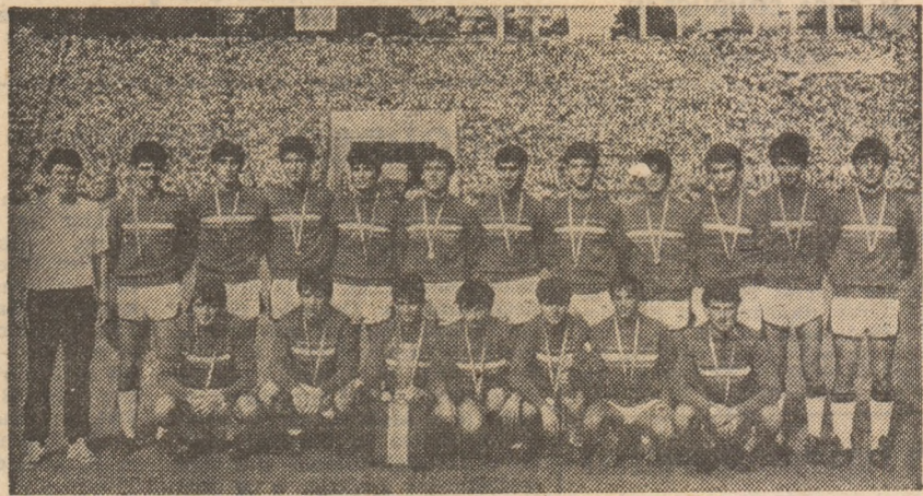
Cea de-a 43-a campioană a țării la juniori, echipa Sportul Studențesc din București, fotografiată la câteva minute după cucerirea titlului pe 1985-1986.

Se pot închiria: costume de baie, echipament pentru sala de gimnastică, prosoape, căști, papuci de baie Abonamente lunare pentru 12 intrări. Program zilnic: 8-20. Informații suplimentare la telefon 15.58.50/2946.