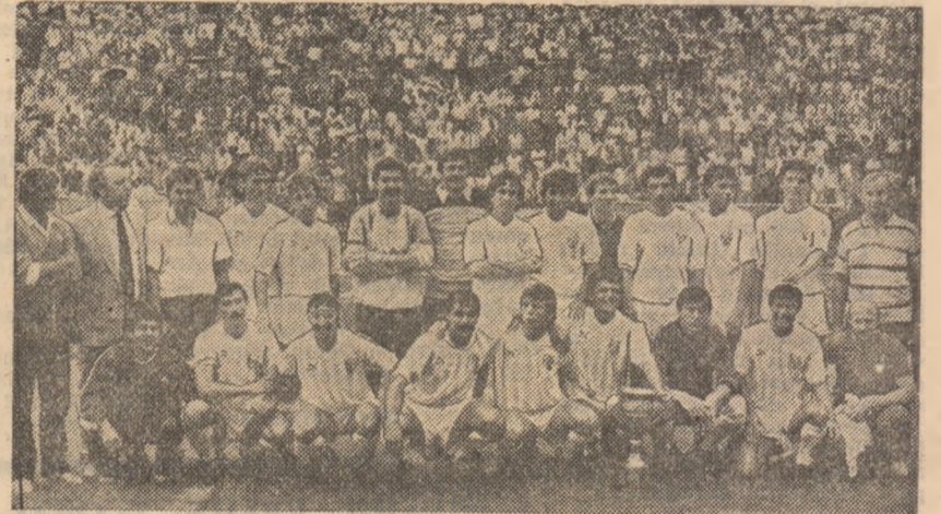
Lotul dinamoviștilor bucureșteni după cucerirea pentru a 6-a oară a Cupei României

Cuplajul găzduit ieri după-amiază de cel mai mare stadion al țării, care a marcat finalul stagiunii fotbalistice, ne-a oferit frumoase satisfacții, dar și unele dezamăgiri. Satisfacțiile le-am avut în special la meciul din deschidere, în care cele două merituose finaliste ale campionatului republican de juniori ne-au încântat realmente prin jocul lor spectaculos, prin golurile superbe și loviturile de la 11 metri (pentru departajare) cu dezinvoltură executate. Prin contrast, partida vedetă, dintre Steaua și Dinamo s-a situat adesea sub cota exigențelor publicului și a posibilităților de care dispun cele două formații fruntașe ale fotbalului nostru. Firește, așa cum era de așteptat, finalistele populare noastre competiții - Cupa României - s-au angajat în această nouă dispută a lor cu multă ambiție și dirzenie, în dorința - mani-