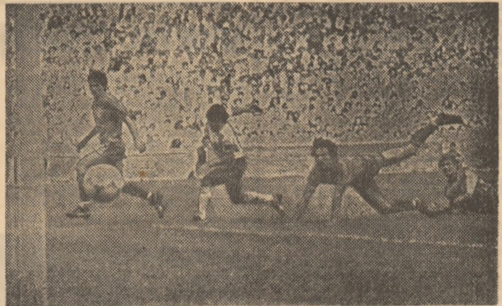
Primul gol argentinian

puțin de Schumacher, Briegel, K. H. Förster, Rummenigge, Litvinski (supraviețuitorii dramaticei semifinale de la Sevilla), precum și de coșchăpiarii acestora, care au demonstrat, împreună, vigoare și ambizie rar înfîntate, dar, de data aceasta, și o tehnică de concușă în viteză, superioară celei elalată de reprezentativa „Cocoșului Galic”. Trist, sub influența modestei prestații a compartimentului — de regulă „forte”