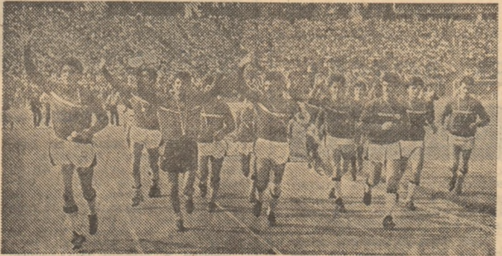
Turul de onoare al noii campioane de juniori, echipa Sportul Studențesc

toț ce pot ca să cîștige astăzi; cu atît mai mult, cu cît, acum doi ani, am ratat copilărește în fața Partizaniului Bacău”. La un sfert de oră după finală, Stănci, îmbrăcat cu tricoul de campion, s-a dus și l-a îmbrășcat pe căldură pe Răduciou, cel care continua să fie marcat de eșecul echipei sale, Dinamo. Erau mezinii finalei, ambii componenți ai selecționatei U.E.F.A. '88, virfulle de atac ale acestei echipe care, nu peste multă vreme, va pleca în R.P.D. Coreeană, la Turneul Prietenia.