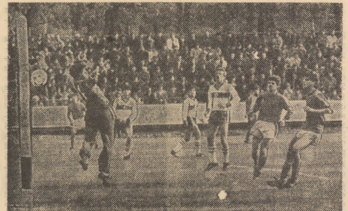
O „secvență” cu juniorii noștri în ofensivă, în partida cu echipa Turciei, disputată în toamnă, la Plopieni (4-0 pentru „tricolori”).

Coreeană, 15-28 iulie), dar mai ales cele din viitoarele preliminarii ale Campionatului european A pe care le va susține. Iată echipa care a susținut cele mai multe meciuri în primăvara lui '86: Diaconescu — Tatu, Bucur, Stan, Aprodu — Oprea, Răchită, Minea — Moldovan, Răduciuiu, Stănică, (rezerve: Brezoi, Ștef, Alexandru, Tofan).