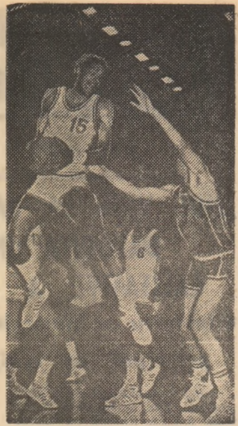
Aspect din recenta întâlnire dintre Franța și S.U.A., desfășurată la Paris, în sala Coubertin.

Primele trei clasate din aceste serii preliminare vor forma două grupe semifinale, în cadrul cărora se va juca la Oviedo și Barcelona, între 13 și