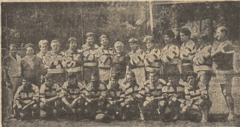
Lotul rugbyștilor de la GLORIA București, una din promovatele în Divizia A

De fapt, rugbyștii bucureșteni revin în primul eșalon după o reșezare a lotului și a conducerii tehnice. Antrenorul echipei a fost, în această reu-