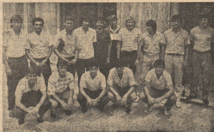
Vacanța s-a terminat! Incepe luna de pregătire intensă a fotbalistilor pentru startul în campionat (16 august) și în marile competiții europene

În cuvîntul său, Mircea Luceșcu s-a referit la faptul că, spre deosebire de alți ani,