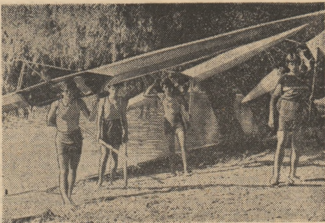
Sintem în plin sezon nautic, cu multe echipaje pe lac, cu mulți elevi aflați în minitabere de vacanță, ridicate pe malurile apelor: la „Metalul”, pe Pantelimon, la „Triumf” (imaginea de față), pe lacul Herăstrău...