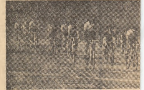
Sosire strînsă într-unul din sprinturile cursei

ta) 13,2, 4 13,3, ambi puncte, 30 care trei llimpia) 22 19 p. 3. Ivan (C.S. du 8 p. 6 7 p; omn 2. P. Radt Dacă ac se desfășc sensul că consemnăr făsurare. și pe eta: te rău. L