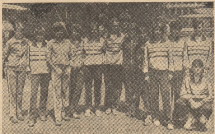
O parte din lotul de atleți români care participă la „mondialele” de la Atena