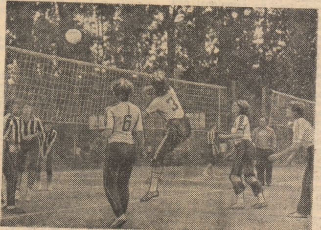
La Complexul cultural-sportiv de la Lacul Tei, voleiul, alături de alte ramuri de sport, se bucură, în aceste zile ale vacanței de vară, de o numeroasă participare.

prezenți alți aproape 15 000 de studenți și studente. Pentru ei au fost fixate ca locuri de tabără stațiuni situate pe coronamentul Mării Negre (Eforie Nord, Eforie Sud, Costinești și Saturn), pe Valea Prahovei (Sinaia și Bușteni) și a Cernnei (Băile Herculane), în toate cazurile cu posibilități largi de a practica exercițiul fizic și sportul în mod organizat, existînd cluburi