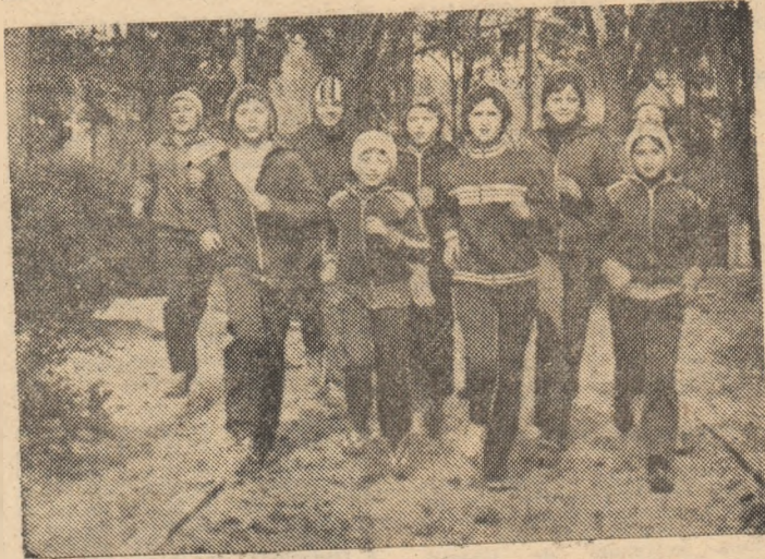
Pregătirea pionierilor din județul Prahova pentru „jocuri” debutază cu probe atletice, crosul constituind un element prioritar.

Patru finale republicane — un veritabil Festival al sportului pionieresc, unul din momentele de referință ale vacanței mari!