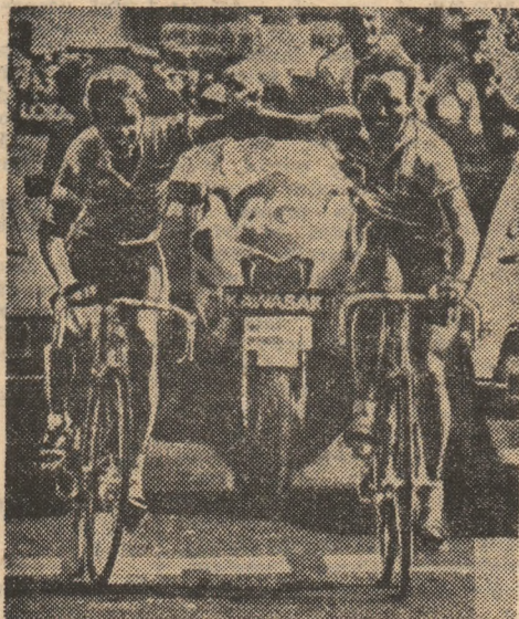
Greg Lemond și Bernard Hinault termină „la braț”, etapa a 18-a, de la Briançon la Alpe d'Huez. Cum va fi însă mai departe?