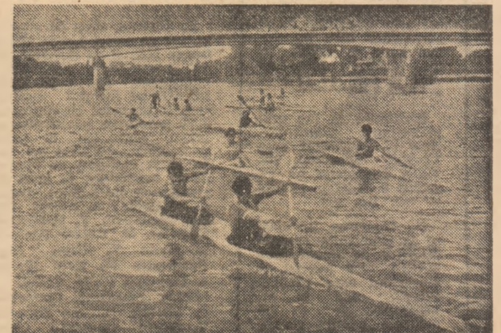
Pe Mureș, la Arad, antrenamentele caiacistilor și canoistilor continuă non-stop