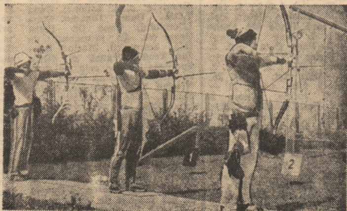
Turul cu arcul, un sport frumos, îndrăgit de tinere și tineri, cîștigă tot mai mulți aderenți. Iată, în imagine, cîțiva arcași la un concurs.