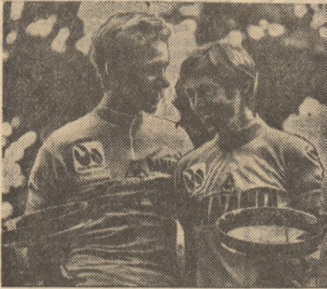
Cei doi cîștigători ai Turului Franței '86: Greg Lemond și Maria Canins.

Ediția din acest an a întrecerii a revenit unui renumit rutier, americanul Greg Lemond, care s-a făcut remarcat începînd din etapa a 17-a, un ciclist complet, bun călător, dar și vitejist, rezistent, întrecător, îndeminatic. Duelul său cu Bernard Hinault, pe care l-a lăsat în urmă cu peste trei minute, a fost, în fapt, momentul de suspens al ultimelor etape. Deși „hărțuit”, ca oricare dintre purtătorii tricoului galben, Lemond a știut, de fiecare dată, să iasă cu bine din diferitele situații dificile în care a fost pus de adversarii și, mai ales, de colegul său de echipă... Hinault, ambii făcînd parte din formația franceză „La vie claire”, cîștigătoare pe echipe, cu 331.35:48 (a fost urmată de Peugeot-Shell 333.27:38 și Systeme U 333.36:38 etc.).