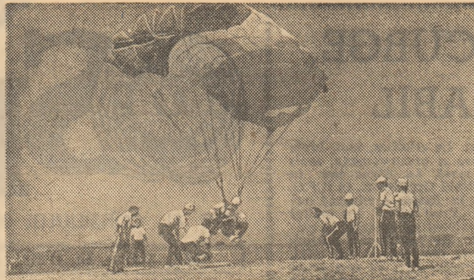
Proba de aterizare la punct fix a prilejuit și de această dată o dispută spectaculoasă

REZULTATE TEHNICE. Proba de aterizare la punct fix (6 marse), individual, feminin: 1. Marta Hosu (Brașov) 0,37 m, 2. Florica Uță (București) 0,62 m, 3. Rodica Suciu (Tg. Mureș) 1,23 m, 4. Valerica Popescu (București) 2,40 m, 5. Aurelia Tudorică (București) 3,03 m; masculin: 1. Vasile Mihanciu (Sibiu) 0,05 m, 2. Nicolae Radu (Brașov) 0,09 m, 3. Cristinel Popescu (Brașov) 0,12 m, 4. Marian Panait (Buzău) 0,14 m, 5. Alexandru Ciobanu (Iasi) 0,17 m; proba de acrobatie (3 marse), individual, feminin: 1. Marta Hosu 28,23 s, 2. Florica Uță 28,72 s, 3. Valerica Popescu