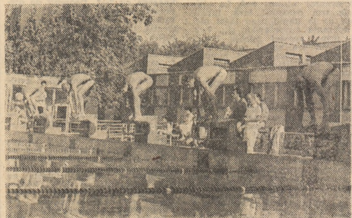
Start în cea mai disputată serie, cea a frunțașilor...