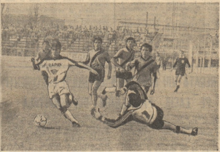
Goanță (Rapid) și Ciurea (F. C. Olt) în plină luptă pentru balon. La capătul acestei acțiuni, bucureșteanul va trimite mingea în bară

In vederea meciurilor de fotbal amicale de miercuri