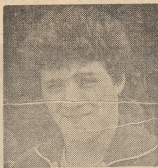
secretarul său general, tovarășul NICOLAE CEAUȘESCU, ctitorul României moderne, în care tinerii trăiesc o viață fericită.

„Trei medalii de aur, una de argint și un nou record mondial”, „Două medalii de aur, una de argint și un valoros record mondial”, „Pușcașii noștri au cucerit medalia de argint pe echipe” — iată vestile care ne-au sosit de la Osijek (Iugoslavia), acolo unde se desfășurau Campionatele Europe-