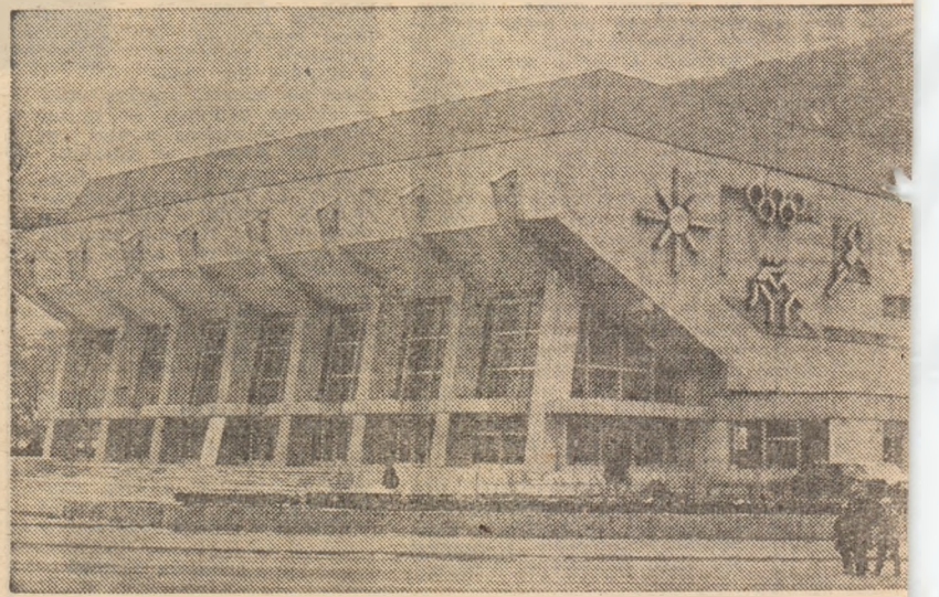
În Reșița, s-a înălțat în acești ani rodnicii o perle a sportului : sal

NICOLAE MANEA component al echipei de fotbal Rapid