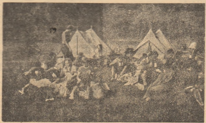
După concurs, scurt popas lângă corturi. Urmează festivitatea de premiere...

După 4-5 ore, unii după chiar mai mult de 10 ore, iubitorii muntelui din județul Sibiu au revenit la „centru“.