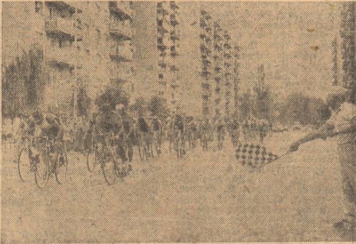
Plutonul angajat în sprintul intermediar de la Buzău, din etapa inaugurală.

PIATRA NEAMȚ, 1 (prin telefon). Cea de a doua etapă a Turului ciclist al României, desfășurată pe ruta Focșani - Adjud - Bacău - Buhuși - Piatra Neamț (161 kilometri), a avut ca prolog startul festiv dat din fața Sălii Sporturilor din orașul de reședință a județului Vrancea. După prezentarea concurenților, maestrul emerit al sportului Marin Niculescu, câștigător în 1959 al inconjurului țării pe bicicletă, a înmănat tricoul galben liderului Sergiu Oprescu (IMGB), autorul unei excepționale evadări în etapa inaugurală, când a rulat, cale de 175 km, solitar în fruntea plutonului. Tot liderului, fostul lui dascăl în tainele ciclismului la Olimpia București, i-a înmănat și tricoul roșu, semn distinctiv al celui mai bine clasat dintre sprinteri.