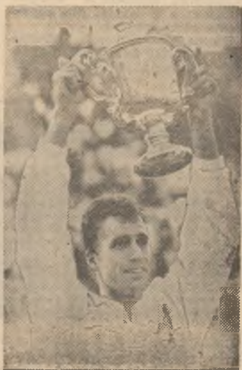
Învîgător la Flushing Meadow, Ivan Lendl conduce autoritar în clasamentul A.T.P.