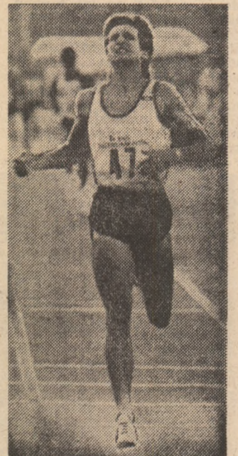
Proaspăt campion european pe 800 m, englezul Sebastian Coe a declarat zilele trecute: „Cum recordul meu mondial (n.n. 1:41,63) datează de 5 ani și cum, în sfîrșit, mi-am văzut încununat eforturile prin medalia de aur de la Stuttgart, cred că e timpul să mă opresc și, la 29 de ani, să las totuși celor mai tineri!” Asta nu vrea să însemne că „Seb” va renunța la atletism. El intenționează doar să se dedosească alergărilor mai lungi, gândindu-se la 1.500 m, distanță pe care a dobîndit două titluri olimpice (1980 și 1984), și la 5.000 m, care ar reprezenta o premieră.