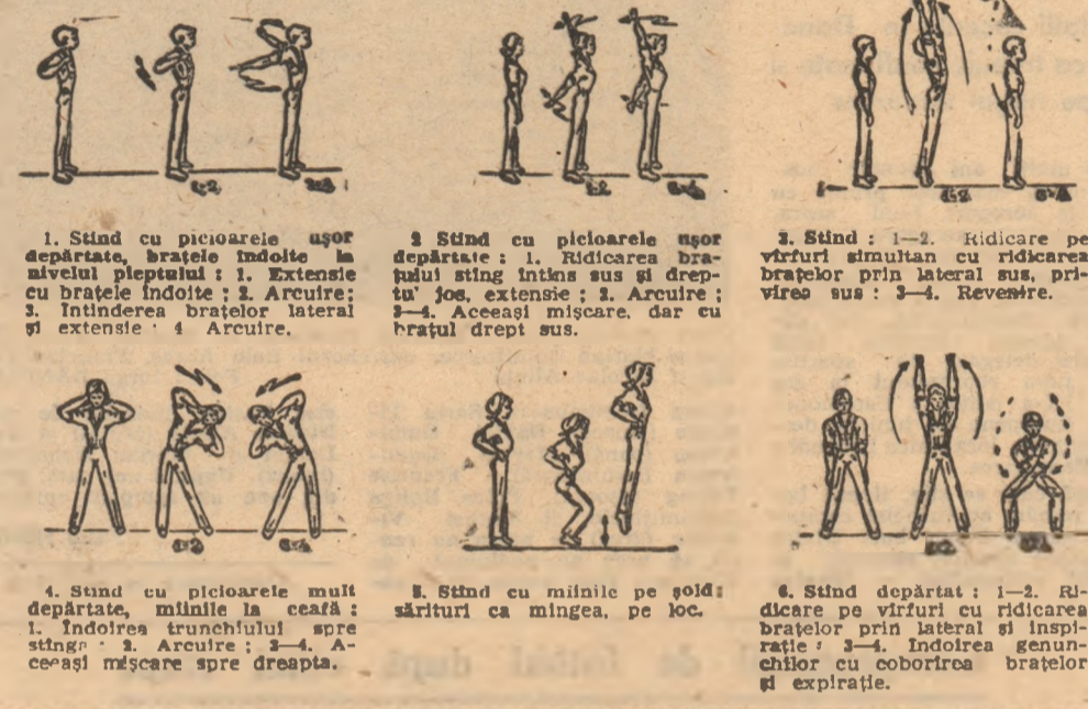
1. Stînd cu picioarele ușor depărtate, brațele îndoit la nivelul pieptului: 1. Extensie la brațele îndoit; 2. Arcuire; 3. Întinderea brațelor lateral și extensie; 4. Arcuire. 2. Stînd cu picioarele ușor depărtate: 1. Ridicarea brațului stîng întins sus și drept jos, extensie; 2. Arcuire; 3-4. Aceeași mișcare, dar cu brațul drept sus. 3. Stînd: 1-2. Ridicare pe vîrfuri simultan cu ridicarea brațelor prin lateral sus, privirea sus; 3-4. Revenire. 4. Stînd cu picioarele mult depărtate, mințile la ceață: 1. Îndoarea trunchiului spre stînga; 2. Arcuire; 3-4. Aceeași mișcare spre dreapta. 5. Stînd cu mințile pe șold: sărituri ca mingea, pe loc. 6. Stînd depărtat: 1-2. Ridicare pe vîrfuri cu ridicarea brațelor prin lateral și inspirație; 3-4. Îndoarea genunchilor cu coborîrea brațelor și expirație.