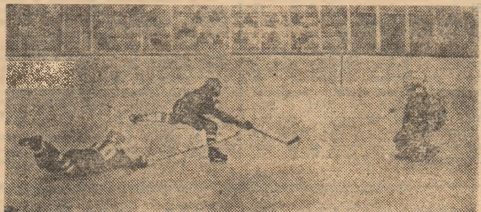
Fază fierbinte la poarta echipei S. C. Miercurea Ciuc