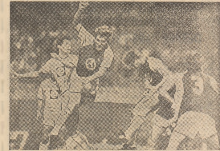
Publicind această fotografie de la meciul Rapid Viena — F. C. Bruges, 4-3, în Cupa Cupelor, vă reamintim că miercuri, 1 octombrie, sînt programate partidele retur din mînșă 1 a cupelor europene intercluburi.

DANEMARCA — R.F.G. 0-2 (0-2) la Copenhaga, în fața a peste 43 000 de spectatori, record absolut ! Prilejuit de retragerea