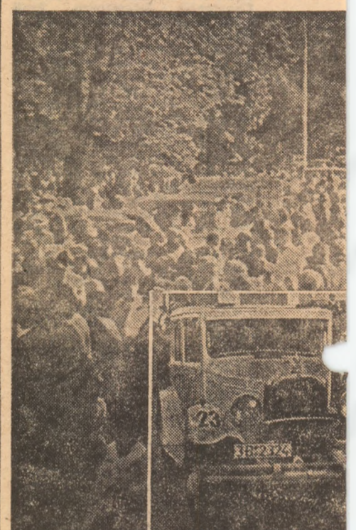
...Cum se opreau mașinile, în jurul lor se strîmînau, un automobil Citroen 1928

A fost frumos... A început pe platoul Halei Obor din Capitală, unde „eroinele” — automobile de epocă (construite între 1920—1940) — erau gata de plecare, una înghăi alta, ca într-o veritabilă expoziție. Roșii, galbene, negre, albe, cu vopsea proaspătă și cu ornamentele nichelate strălucind în soare. Adevărate bijuterii, unele. Între ele un Fiat produs în 1919, un Steyer — 1927, un Citroen — 1928, un Berliet — 1925, un Ford — 1932. Siluetele automobilelor, de tot felul. Înalte și dreptunghiulare: înalte, dar cu o formă rotunjită deasupra (în față și în spate); mici-joase, decapotabile; cu un port-bagaj în spate care, deschis, scoate la iveală încă... două locuri; cu cauducurile de rezervă pe a-