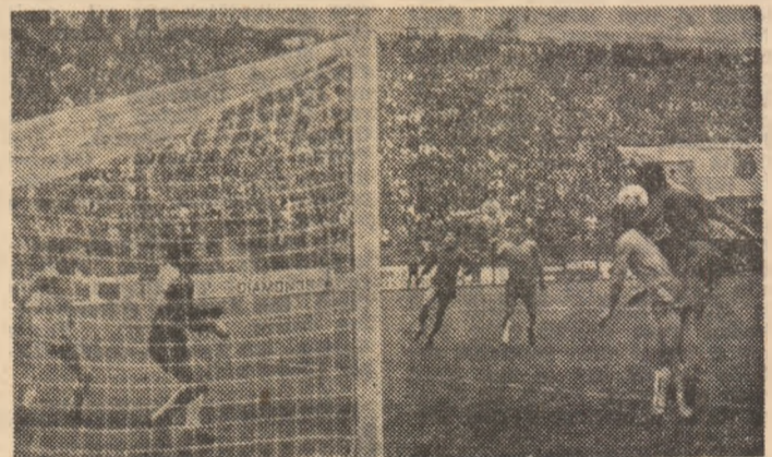
Pițurcă a sărit la o minge înaltă și va înscrie cel de al 3-lea gol al echipei sale