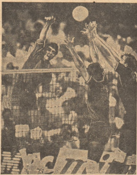
Sovieticul Sorokoleț încercînd să depășească blocajul voleibaliștilor americani

Iată clasamentul final în ediția a XI-a a C.M. masculin: 1. S.U.A., 2. U.R.S.S., 3. Bulgaria, 4. Brazilia, 5. Cuba, 6. Franța, 7. Argentina, 8. Cehoslovacia, 9. Polonia, 10. Japonia, 11. Italia, 12. R.P. Chineză, 13. Grecia, 14. Egipt, 15. Taiwan, 16. Venezuela.