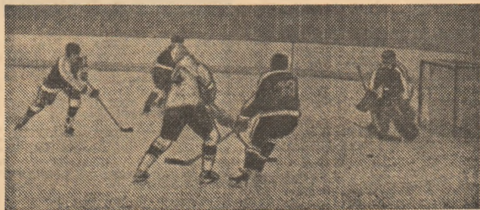
După cum se știe, echipa Steaua a debutat spectaculos în C.C.E., întrecînd pe T.S.K.A. Sofia cu 14-0, în primul meci, de la care vă prezentăm această imagine. Returul joi, la Sofia.