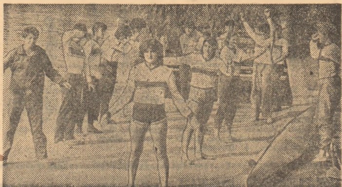
Sportivele de la C.S.U. Construcții, la o „reprimă de încălzire”, înainte de a ieși cu caiacele pe lacul Herăstrău

mai frumos ca oricînd, iar o puștoaică - atunci venită pentru selecție la club - îngina fascinată la marginea pontonului: „Dragoste la prima vedere, cine ar fi crezut?” — Cunoașteți melodia?, mă întreabă ea. — Cunoaște antrenorul, răspund.